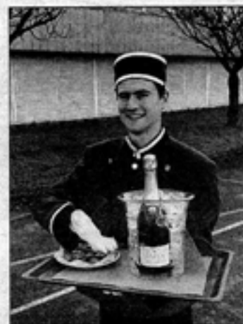
Le groom Spirou : « à vot' service M'dame ».

On a tous en tête l'image de Spirou, héros de bande dessinée éponyme, et de son célèbre costume rouge de groom... Surfant sur la vague de ce philanthrope en culotte courte, Organi'Z Tout vous propose un service de livraison personnalisé, en tenue de groom. Le concept est simple : un Spirou sonne à votre porte, vous appor-